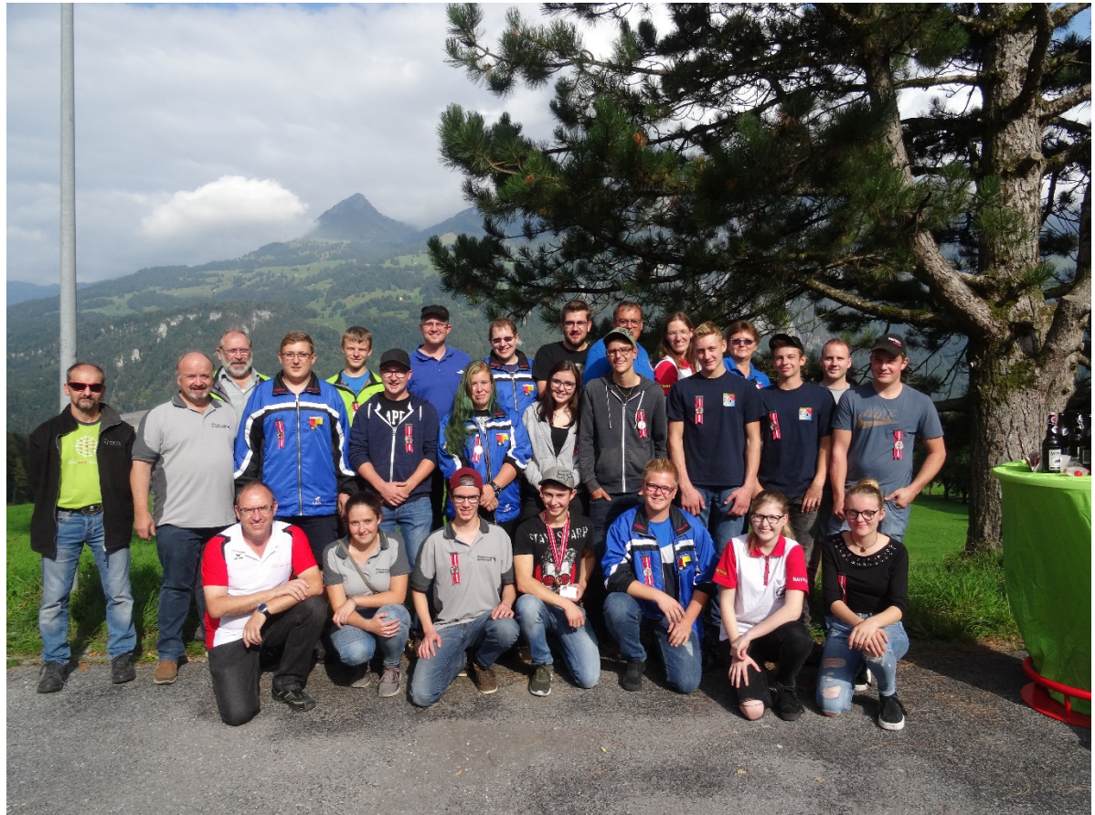
Alle beteiligten Schwyzer Jungschützen/in mit ihren JS-Leitern und Betreuern