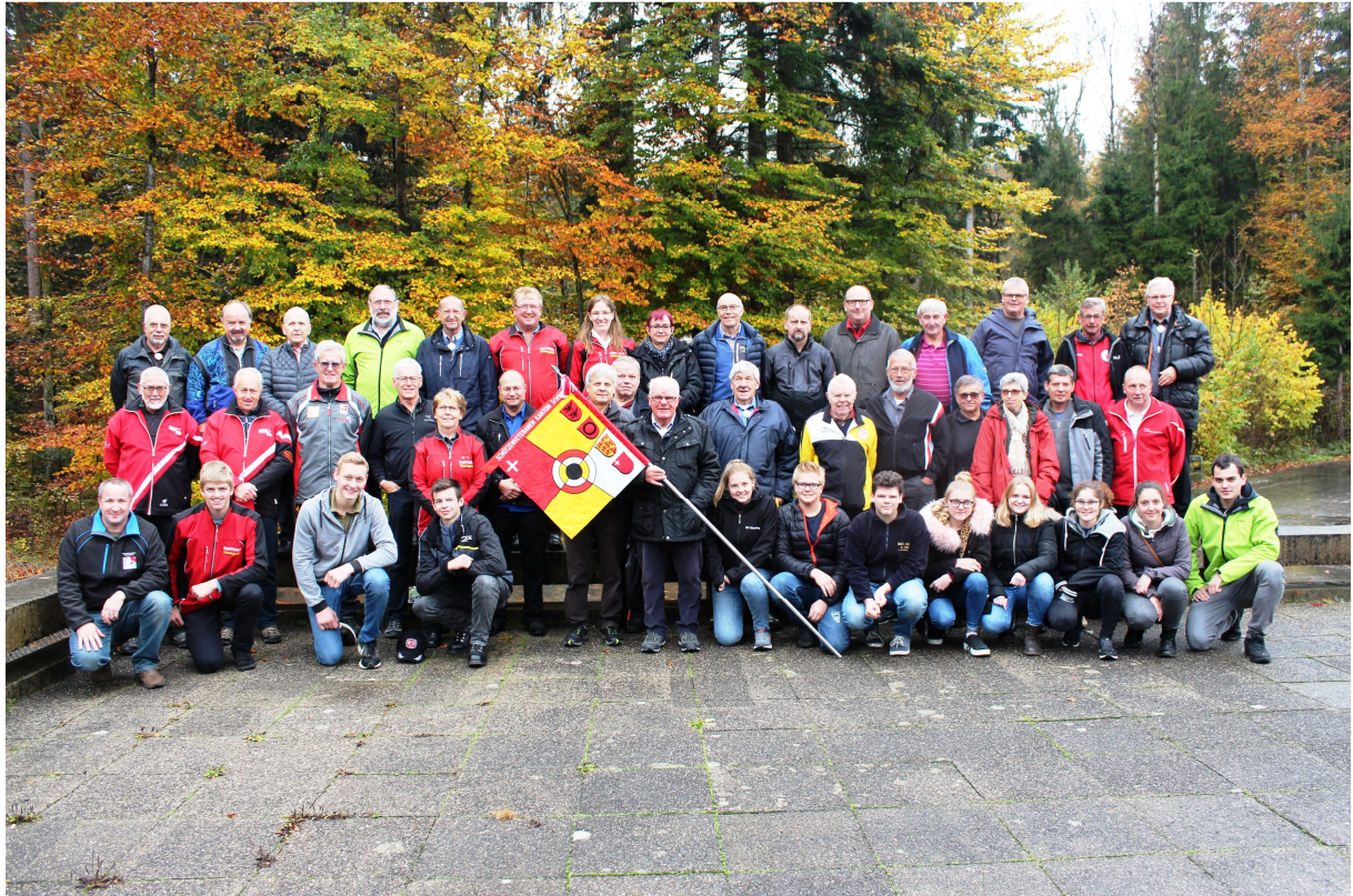
Die Schweizer Schützendelegation am JU+VE-Final 2018 in Thun zusammen mit Begleitern und Betreuern