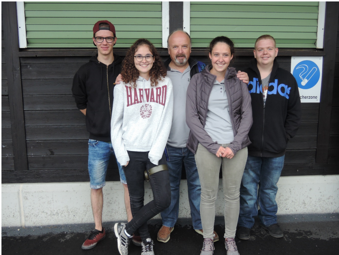
JS-Gruppe MSV Brunnen 1

Recht herzliche Gratulation allen Beteiligten zu euren tollen Resultaten !