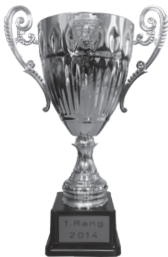
Grosser Rothenthurmer-Becher 300 m