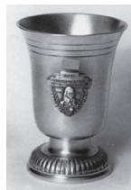
Kleiner Rothenthurmer-Becher 300 m