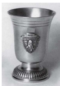
Kleiner Rothenthurmer Becher 300m