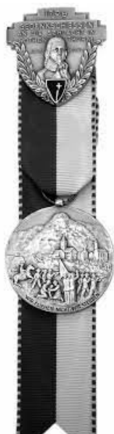
EINZELAUSZEICHNUNG: Kranz oder Kranzkarte