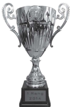
Rothenthurmer Becher 300m